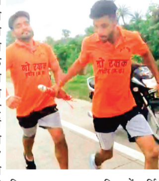
परिसर में धार्मिक माहौल छा गया। भजन-कीर्तन हुए, प्रसाद वितरण हुआ और नगरवासियों ने जगह-जगह फूल वर्षा का स्वागत किया।

पंचोर। सावन के पवित्र महीने में गो माता को राष्ट्र माता घोषित करने की मांग को लेकर गो सेवकों द्वारा डाक कांवड़ यात्रा का आयोजन किया गया। समस्त गो सेवक के बैनर तले 48 युवा कांवड़ियों की टोली राम घाट उज्जैन से शिप्रा का जल लेकर दौड़ते हुए पंचोर प्राचीन शिवालय पहुंचे। जहां भगवान भोलेनाथ का विधिगत जलाभिषेक किया गया। -सुबह 7 बजे कांवड़ियों का जलया बाइक से घाट के लिए रवाना हुआ। शिप्रा से पवित्र जल 5 भरकर युवाओं ने दौड़ शुरू की। - यात्रा की खास बात यह रही कि - जल एक विशेष बांस से बनी कांवड़ में भरा गया,