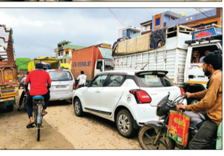
इस दौरान भोपाल इंदौर सहित अन्य मार्ग पर चलने वाली यात्री बसें और एक एंबुलेंस भी फंस गई इधर देे पहिया वाहन