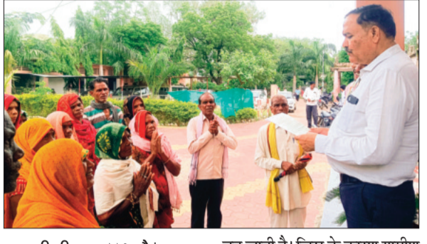
हरिभूमि न्यूज आष्टा

15 जुलाई से 30 जुलाई तक चलाये जा रहे नशा मुक्ति अभियान का असर भी नजर आ रहा है। जहां एक तरफ प्रशासन जगह-जगह जागरूकता कार्यक्रमों के माध्यम से लोगों को नशे से दूर रहने और नशे के दुष्परिणाम बता रहे हैं। इसी पहल के चलते अब सीहरे जिले की भैरूद के ग्राम अंबा कदमी में भी नशे के खिलाफ पूरा गांव खाडा नजर आ रहा है। ग्रामीणों ने गांव में संचालित शराब दुकान को बंद करने के साथ नशा करने वालों पर कार्रवाई करने तक की मांग कर रहे हैं।